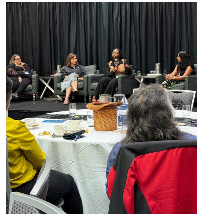
Bénévoles Canada et Volunteer BC à la conférence sur le leadership de Vantage Point à l'intention des organismes sans but lucratif

bénévoles en temps de crise et fournir de la formation et des outils qui amélioreront les capacités organisationnelles. Cependant, de nombreux centres sont peu capables d'explorer et d'assumer des fonctions plus vastes au sein de l'écosystème du bénévolat en raison du sous-financement.