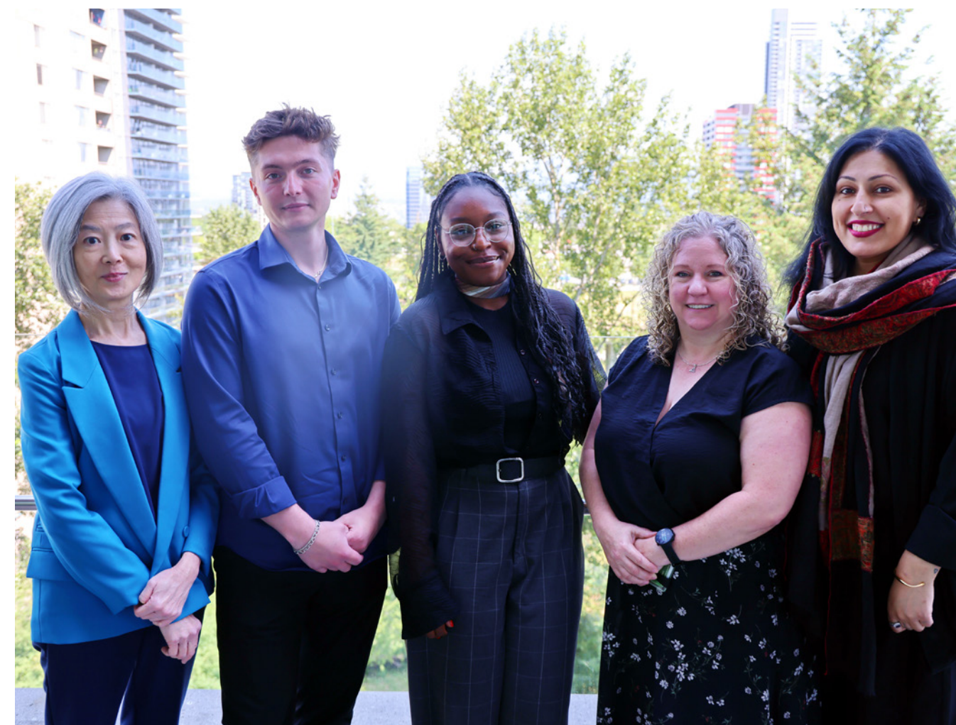
Présentation de la ville de Burnaby sur le bénévolat

Nous avons organisé et facilité, virtuellement ou en personne, 45 séances, conversations, consultations et activations communautaires.