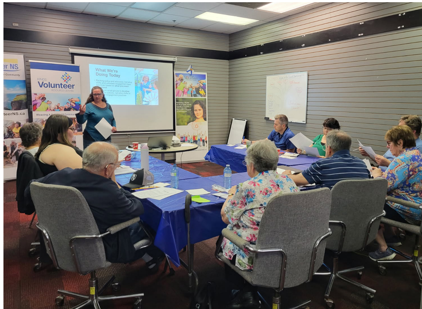
Table ronde de New Minas organisée en collaboration avec Volunteer Nova Scotia

Alors que nous entamons la prochaine étape de l'élaboration de la stratégie, nous allons nous appuyer sur nos priorités stratégiques tout en continuant de peaufiner et de valider les recommandations afin que la SANB reflète bien la réalité et la sagesse des communautés qu'elle vise à servir.