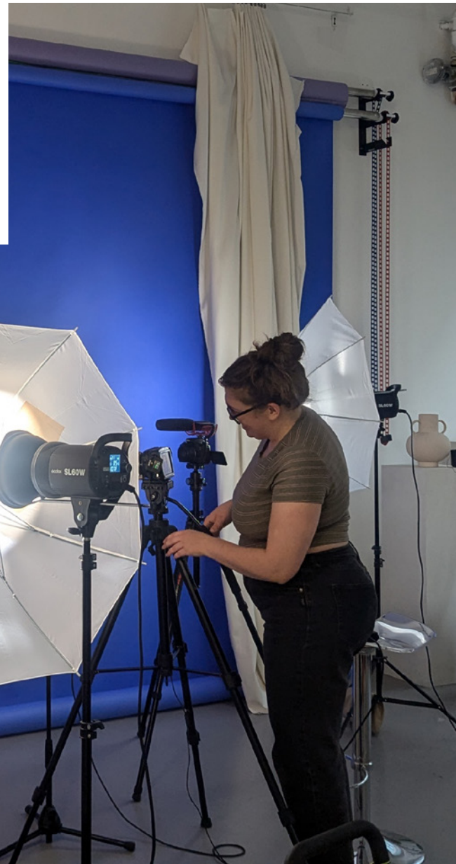
Dans les coulisses de Paver la voie : histoires queer et trans d'aide mutuelle à Montréal

La prochaine étape consiste donc à bâtir les infrastructures qui permettront de mettre cette énergie à profit.